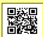
<福祉人材センター>